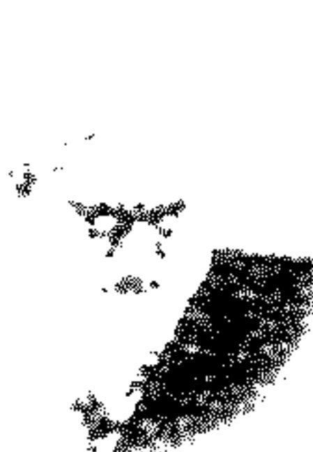
قائد ثورة العشرين المرزا محمد تقی شیرازی قد