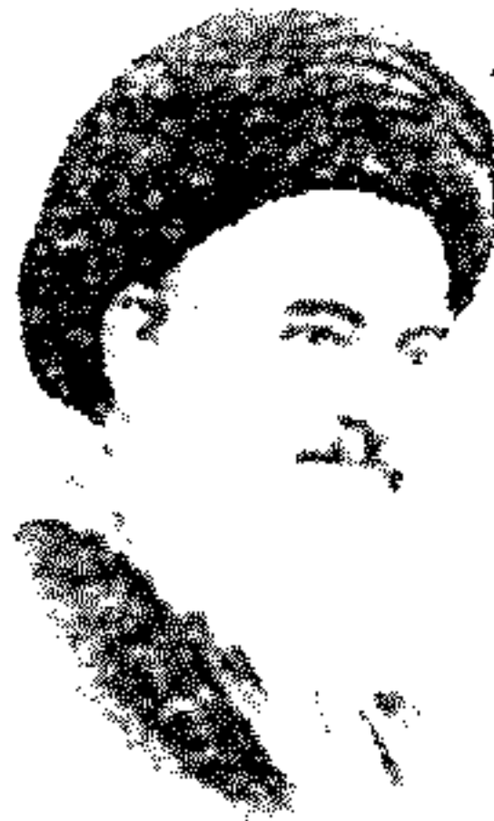
المرجع الديني به الله العقل السيد صادق الحسيني شیرازی دام ظله

مجلس علماء المرجع الاعلى المرجع الكبر السيد عبد الهادي شیرازی قد