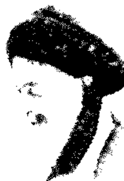
سلطان المؤمنین الحند الثاني الإمام السيد محمد شیرازی قد