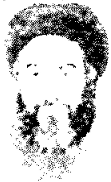
الفكر الاسلامي الشهيد السيد حسن شیرازی قد