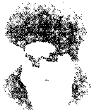
قائد ثورة الهند الحند الثاني سيد حسن شیرازی قد