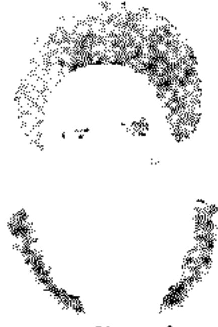
المرجع الاعلى المرزا مشدق شیرازی قد