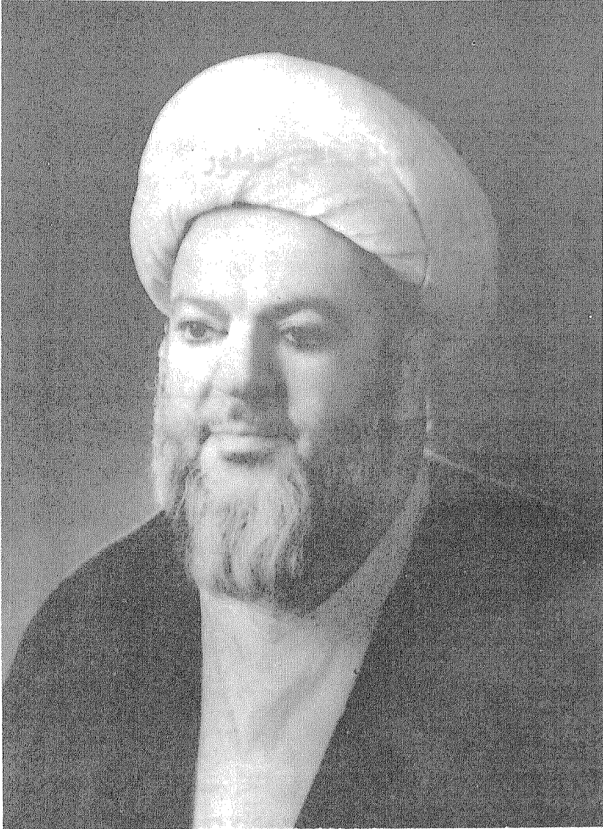
صُورَةُ الْمُؤَلِّفِ (رِه)